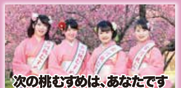
次の桃むすめは、あなたです

古河市観光協会では、古河桃まつりをはじめ様々なイベントを通して、古河市の魅力を伝えていただける方を募集します。